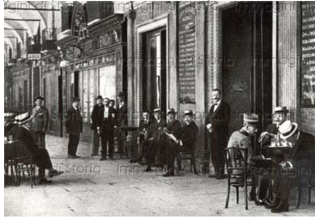
Un caffè sotto i portici del centro di Torino agli inizi del Novecento.

Sul lato destro di via Po, la seconda traversa, via Bogino , era la sede della maggior parte delle ambasciate presso il Re di Sardegna: Francia, Prussia, Austria, Russia, ecc. Al numero 9 c'è lo stabile più bello, Palazzo Graneri della Rocca, al cui piano nobile ha la sede storica il circolo degli artisti, ora circolo dei lettori, negli stessi locali dove era situato il comando militare di Torino durante l'assedio del 1706, ubicato lì sempre perché le bombe francesi non potevano arrivare.