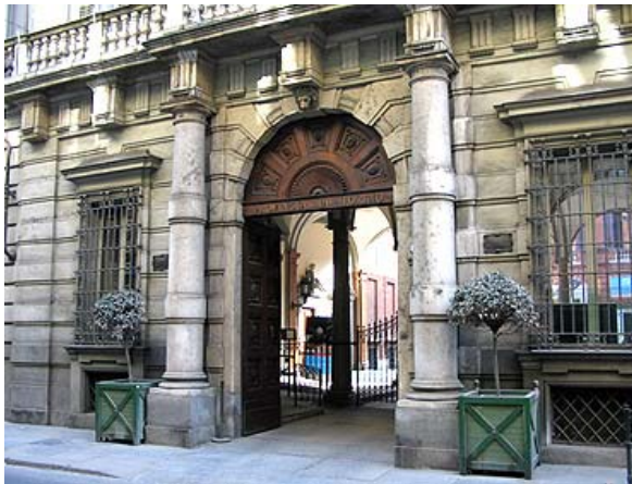
Palazzo del Pozzo della Cisterna

L'angolo opposto è occupato da un decoroso palazzo, gemello di quello all'angolo di via Carlo Alberto, oggi sede della Provincia, che ha un grande giardino che si chiude con un caseggiato. I due palazzi e il caseggiato facevano parte della dote dell'ultima principessa Del Pozzo della Cisterna, Maria Vittoria per l'appunto, che sposò il Duca d'Aosta, fu per qualche anno regina di Spagna e morì giovane. Il titolo di Principe della Cisterna era connesso a un piccolo feudo in provincia di Asti, però feudo pontificio (era pontificio anche il principato di Masserano), perchè in uno stato il cui sovrano era un Duca, non potevano esserci sudditi principi. I Dal Pozzo discendevano da un illustre giurista, e in quanto feudatari dei Savoia, erano anche marchesi di Voghera e conti di Neive. Grazie anche ai feudi in Canavese, erano la famiglia nobile più ricca del Piemonte.