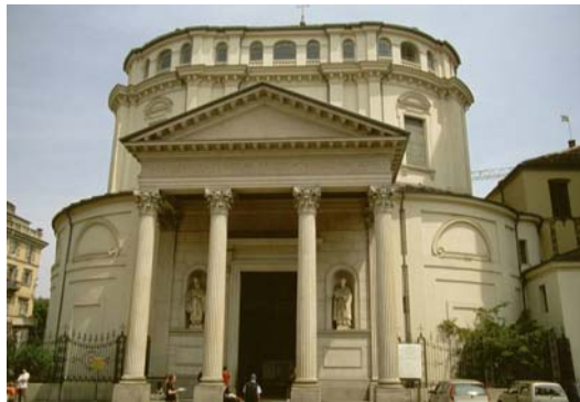
Santuario della Consolata

Nella bella piazzetta antistante, c'è un piccolo caffè con arredi dell'ottocento, celebre per la cioccolata e il "bicerin", antica colazione torinese, che dà il nome al locale