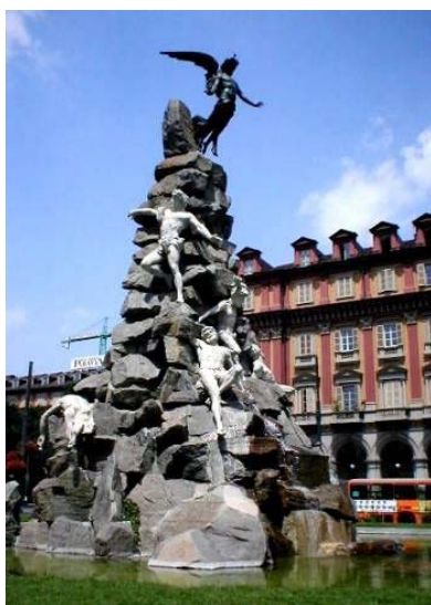
La Fontana del Frejus

Anche il monumento al Frejus, con i caduti sul lavoro, è un po' macabro, se non addirittura esoterico (l'angelo nero con la stella in fronte sarebbe Lucifero, a quell'epoca celebrato dal Carducci come "forza vindice della ragione") Se aggiungiamo che vicino alla piazza e con lo stesso nome c'era il cinema Statuto, dove nel 1983 un incendio fece più di 80 morti, e la piazza di Porta Susa, XVIII dicembre, data di una strage compiuta dai fascisti due mesi dopo la marcia su Roma, dopo aver incendiato la camera del Lavoro, non c'è proprio da stare allegri, e si capisce perché Piazza Statuto sia considerata uno dei siti di Torino magica (o)