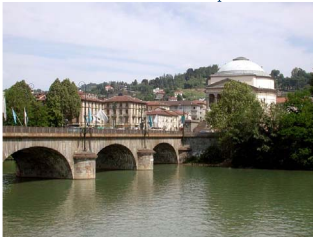
Panorama sul Po

Una curiosità sulla denominazione della chiesa della Gran Madre fatta erigere dal Comune per festeggiare il ritorno dei Savoia nel 1814, che chiude il panorama di piazza Vittorio. Nessuna chiesa al mondo tra quelle dedicate alla Madonna porta il nome di "Gran Madre di Dio" che è il titolo con cui veniva invocata Iside nell'antico Egitto. Evidentemente tra i decurioni comunali dell'epoca ce ne erano molti interessati