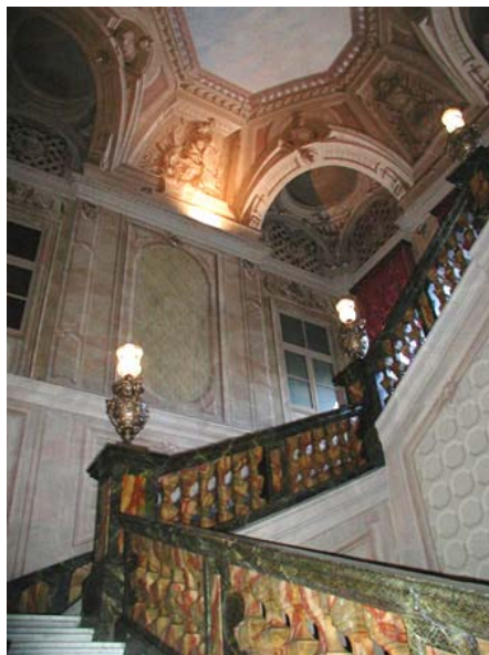
Scaloni di Palazzo Barolo

In Palazzo Barolo si trova anche la fondazione Tancredi di Barolo, che raccoglie libri e pubblicazioni per l'infanzia (l'unica in Italia) e ha costituito un "museo della scuola" per far vedere come si studiava nei tempi andati.