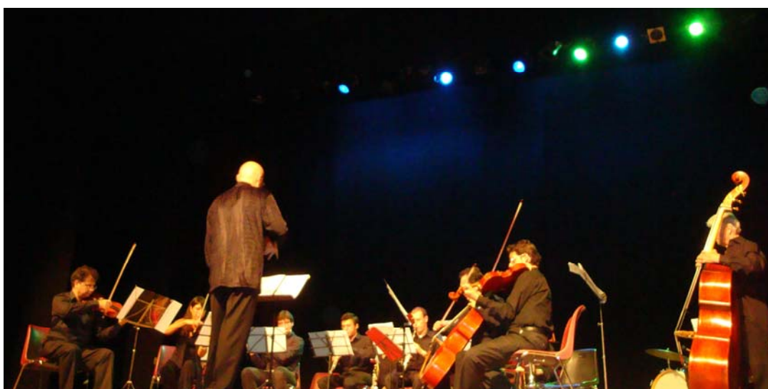
Orchestra Ensemble Europeo Antidogma

A fine concerto, il pubblico presente ha salutato con un grande applauso tutti i protagonisti di questa bella serata, creata per una splendida iniziativa: " Per un futuro senza SLA ".